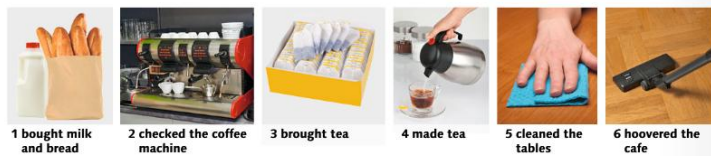
1 bought milk and bread